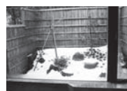
東京短資株 箱根保養所