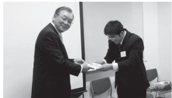
福原理事長より助成金授与