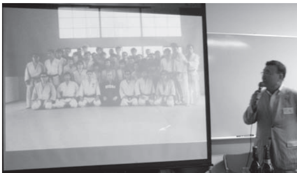
羽山前監督の追悼コーナー