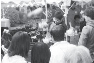
行列のできる「餅屋」の復活

野田キャンパスは模擬店として「餅屋」を開いておりました。一昨年は新型インフルエンザなどの影響で40年の歴史が途絶えましたが昨年は2年の堺を中心に上級生も協力し一団となって再開し1年のブランクも感じさせず行列出来「柔道力もち」が復活しました。