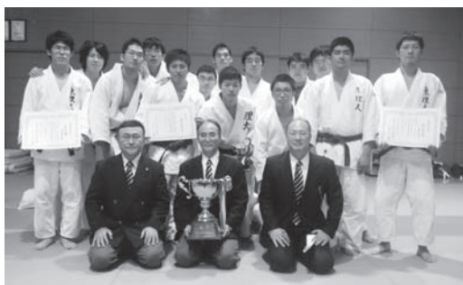
東京理科大学柔道対抗戦

理窓会の情報誌「理科大today」に柔道部が紹介されました。以下がその全文です。